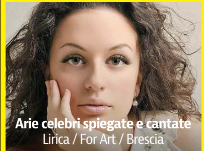
Arie celebri spiegate e cantate Lirica / For Art / Brescia