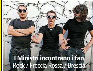
I Ministri incontrano i fan Rock / Freccia Rossa / Brescia

Per il Festival Antegnati, stasera alle 21 in Duomo Vecchio, sullo strumento realizzato nel 1826 dai fratelli Serassi utilizzando quasi tutto il materiale fonico dell'organo Antegnati del 1536, Marco Ruggeri propone la Messa Solenne per organo solo di Vincenzo Petrali (1830-1889), compositore cremasco che prestò servizio come Maestro di Cappella proprio nella cattedrale della nostra città.