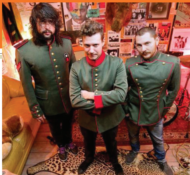
I Ministri oggi al «Freccia Rossa» e poi al «Lio Bar» per presentare «Cultura Generale»

L'uscita è stata anticipata dal nuovo singolo «Idioti»,