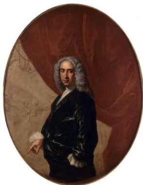
10. Giacomo Ceruti (Milano, 1698-1767)

9. Giacomo Ceruti (Milano, 1698-1767) Uomo con boccale 1737 ca. Olio su tela, 90 x 70 cm Lovere, Accademia Tadini, P 480