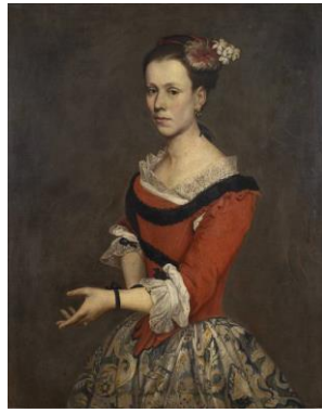
7a-b. Giacomo Ceruti (Milano, 1698-1767)